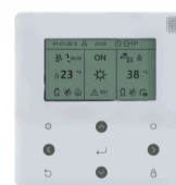
Nástěnný kabelový ovladač